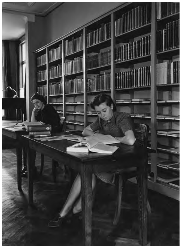
De bibliotheek van het N.A.I.N. in de jaren '40 (fotograaf onbekend)