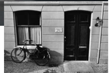
4a. Het NINO was meer dan veertig jaar, vanaf de oprichting van het Instituut tot de ingebruikname van het Witte Singel-Doelencomplex, gevestigd aan het Noordeindsplein (tegenwoordig aangeduid als Noordeindeplein). Links nummer 4a, rechts (met bouwjaar 1872) nummer 6a. Foto R.J. Demarée, 2008.